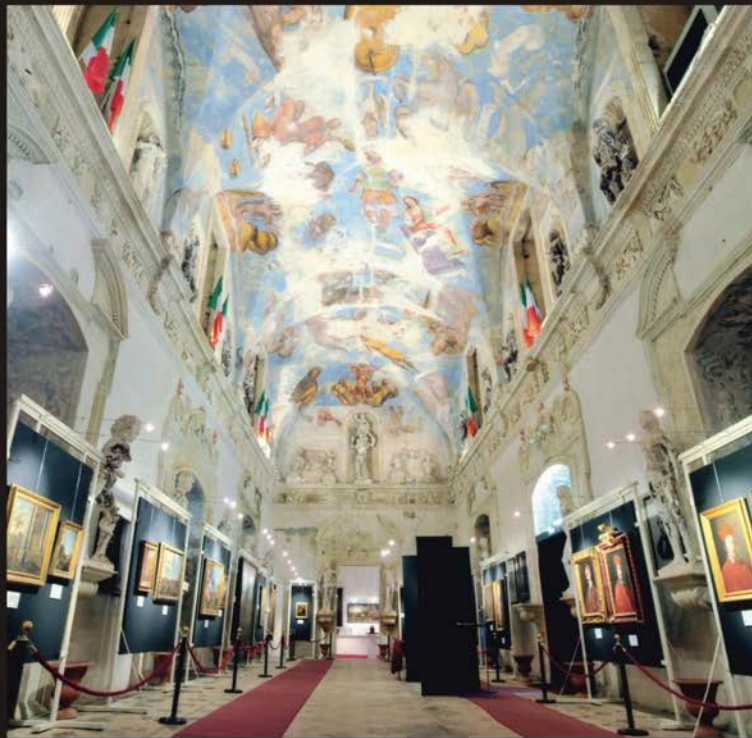
Galleria Palazzo Ducale

La mostra rimarrà aperta dal 26 settembre al 13 dicembre 2015 Orari di apertura: 9,30 - 12,30 / 16,30 - 20,00 - chiuso il lunedì